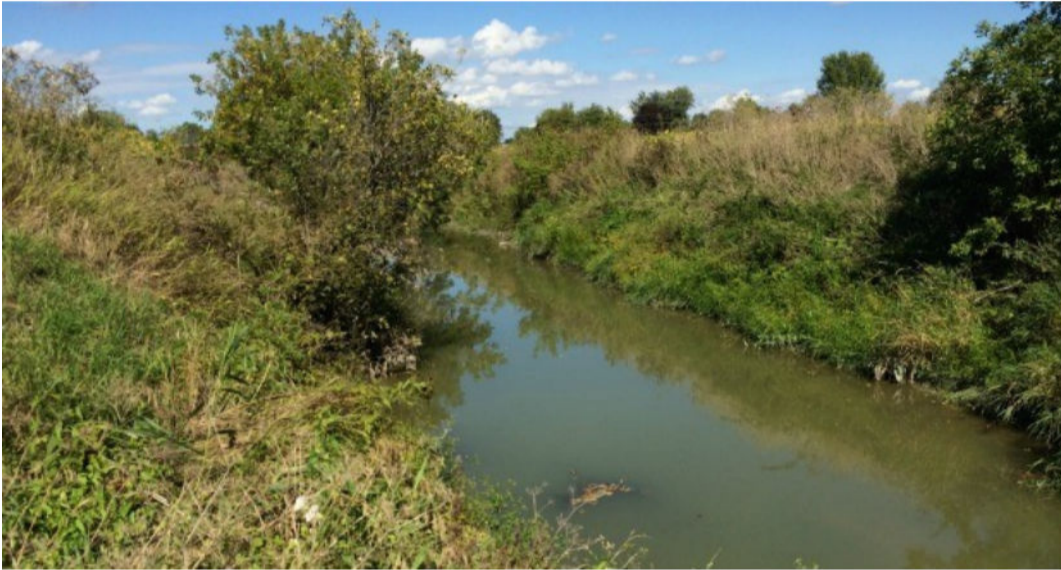
Le ruisseau Beloeil à Saint-Mathieu-de-Beloeil.

Accueil » Articles » Actualités » Un projet pour réunir les agriculteurs et les citoyens