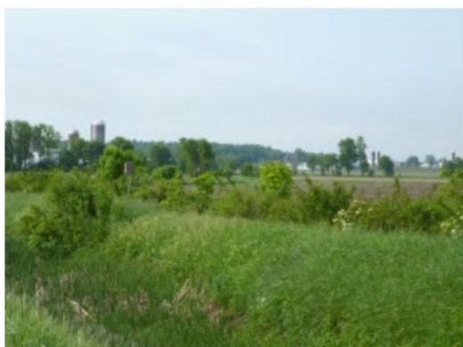
Le ruisseau Beloeil n'est pas suffisamment valorisé, avance le Groupe ProConseil.