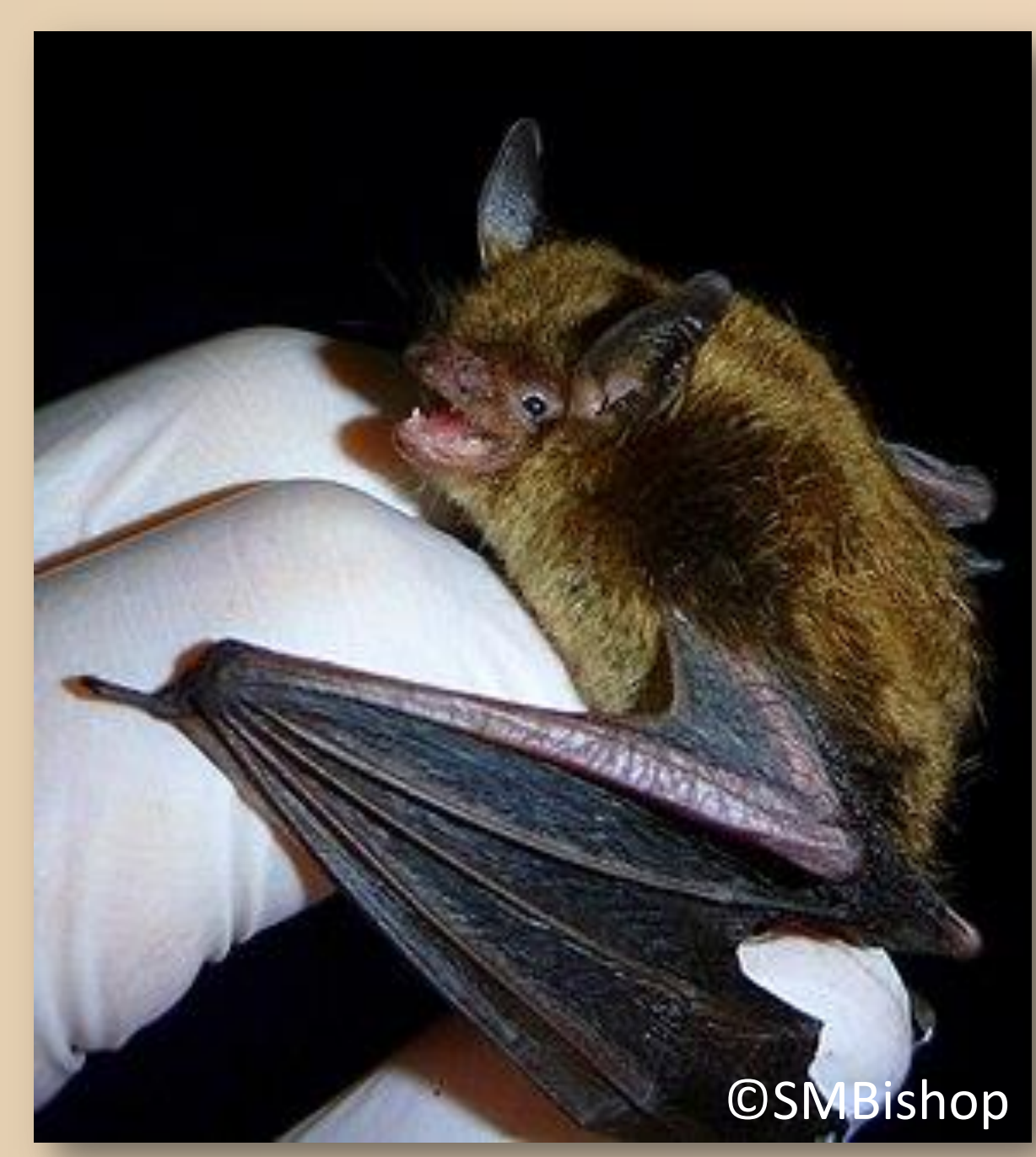
Petite chauve-souris brune