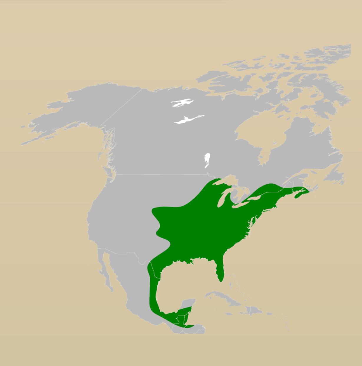
Pipistrelle de l'Est